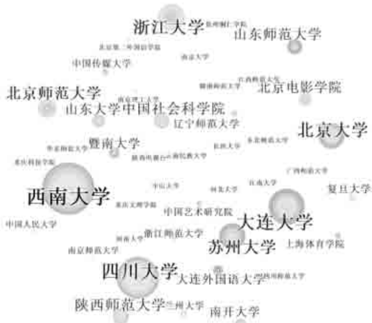
图 1 中国侠文化研究机构聚合图

在研究成果的形成中,相关学术机构将具有同一研究旨趣和相关学术背景的学者聚合起来,或独立或协同进行研究,可以有效地实现研究力量的整体效应。改革开放 40 年来,总计有 287 个机构的学者发表了中国侠文化研究论文。主要研究机构的聚合情况见图 1,发表 10 篇以上文章的研究机构见表 2。机构统计有以下几点需要说明:(1)改革开放 40 年来,不少机构经历了分合及更名等变化,本文按其现有机构名称进行统计,不再统计历史机构名称;(2)人员流动及兼职所带